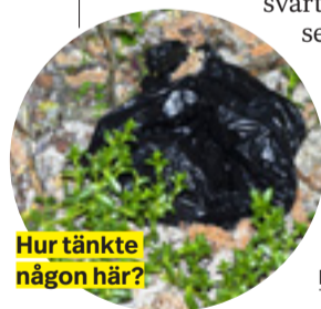
Hur tänkte någon här?

Hur tänker ni hundägare när ni först plockar upp bajset och lägger det i en svart plastpåse för att sedan slänga eller "tappa" påsen i naturen?